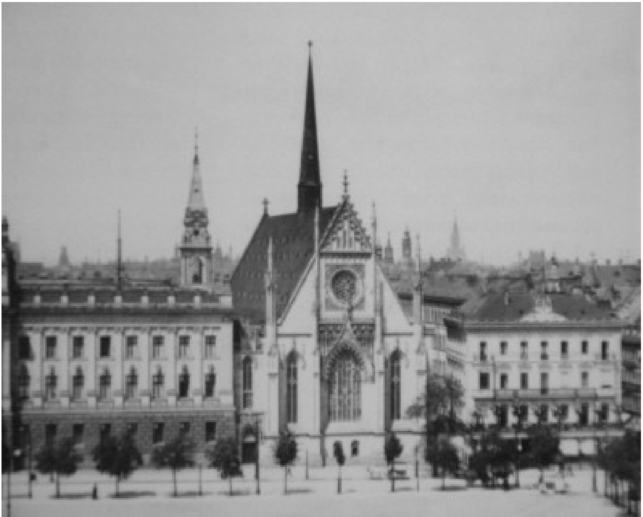
La place et l'église en 1900 lors de la grande campagne photographique des lieux historiques de la ville.