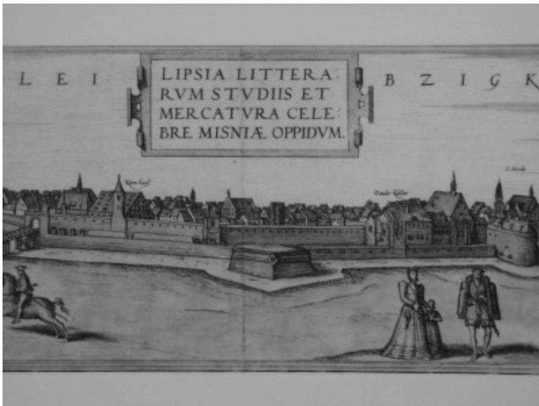
Eglise st Paul et Université de Leipzig en 1547 , un an après la mort de Luther.