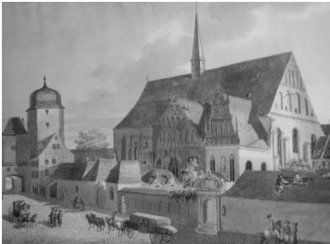
Eglise st Paul en 1790