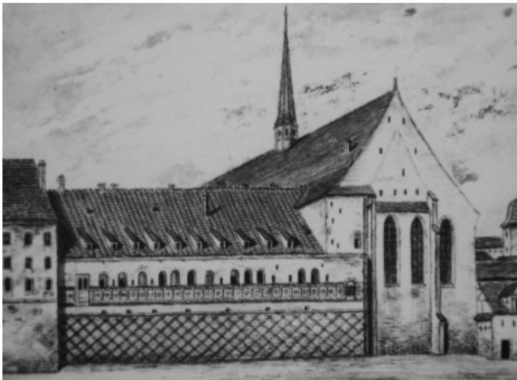
Université et Eglise St Paul en 1830

Ces deux gravures du tout début du 19 ème siècle (60 années après la mort de BACH) montrent l'église st Paul et l'université de Leipzig (dans laquelle Bach donna des conférences) avant la construction de l' Augustusplatz sur l'emplacement des fossés , au pied des fortifications de la ville médiévale. La courtine -on le voit- a d'ailleurs été supprimée sur la longueur nécessaire à sa planification. Au début du 19 ème siècle, elle sera totalement aplanie .